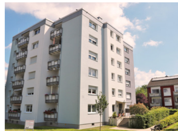
Berliner Ring 56

„Immer auf der Höhe der Technik zu sein – das ist wichtig!“