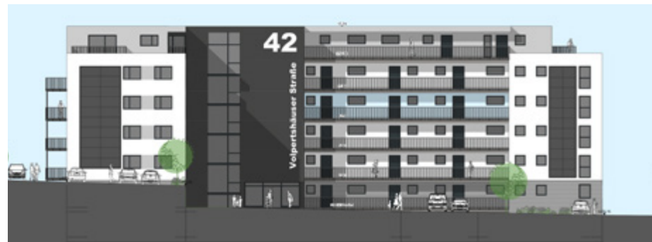
Volpertshäuser Straße 42 – Ansicht Ost

der Volpertshäuser Straße den Klima- und Umweltschutz in den Fokus. Um E-Mobilität zu fördern, sind Ladesäulen vorgesehen. Dabei handelt es sich im Sinne der älteren Bewohner um Lademöglichkeiten für Rollstühle und Scooter, aber auch für Pkw und Fahrräder. Zudem realisieren wir den Neubau als Effizienzhaus 40 EE/NH mit Photovoltaikfassade und sehen Mieterstrom vor.