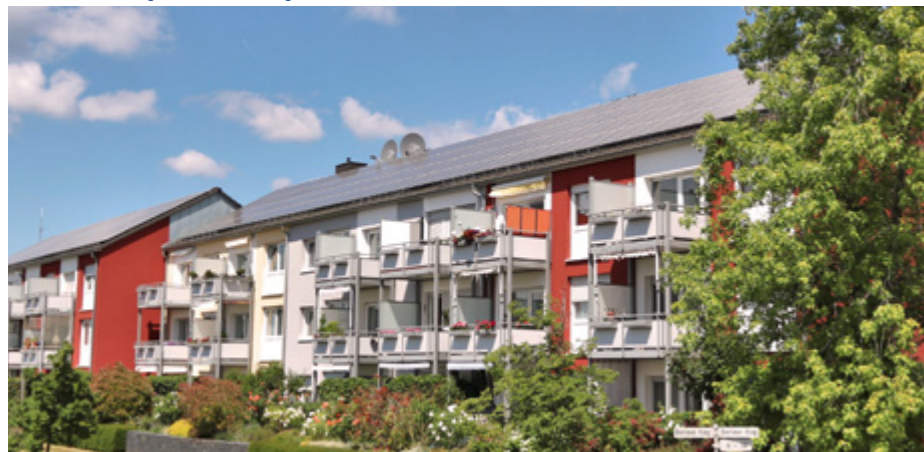
Photovoltaikanlage – Berliner Ring 38-46

Zu bedenken ist, dass die soziale Frage bei sämtlichen Maßnahmen der WWG mit im Fokus steht. Gutes Wohnen muss auch für Menschen mit einem mittleren oder niedrigen Einkommen bezahlbar bleiben. Die Wohnungswirtschaft kann die Klimaziele der Bundesregierung nur dann im gleichen Maß sozialverträglich und wirtschaftlich erfüllen, wenn die Politik die dafür notwendigen Rahmenbedingungen schafft. Es gilt, öffentliche Unterstützungsleistungen intensiv auszuweiten. Quartierslösungen müssen weiter gestärkt und die Verringerung des Treibhausgasausstoßes zum zentralen Faktor für Förderkonditionen sowie Antragsverfahren werden.