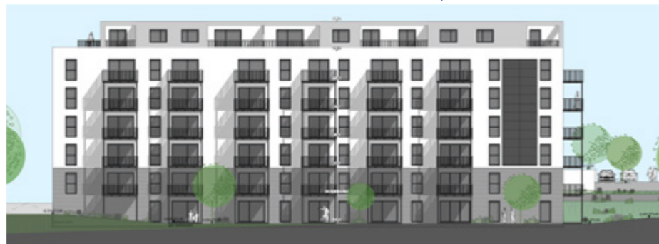
Volpertshäuser Straße 42 – Ansicht West