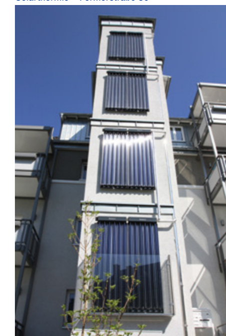
Solarthermie – Formerstraße 80

sich zusammenfassen, dass wir uns in einer Übergangsphase befinden. Derzeit sind wir auf die Nutzung von Gas angewiesen, um die Energieversorgung sicherzustellen. Das soll und wird sich in den nächsten Jahren ändern. Um daraus neben den idealen Lösungen für unsere Liegenschaften auch Chancen zu ziehen, werden wir offenbleiben, die aktuellen Entwicklungen beobachten und uns dafür einsetzen, stets auf der Höhe der Technik zu sein. Und wir sind zuversichtlich, dass wir dabei wie in der Vergangenheit auf die Unterstützung unserer Mieter und Partner zählen können – denn gemeinsam lassen sich neue Möglichkeiten am effektivsten umsetzen.